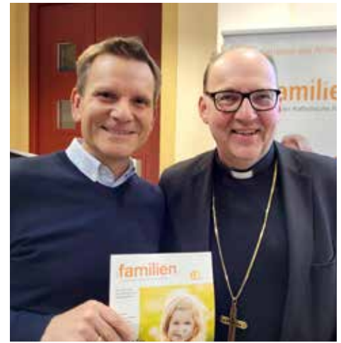
Bischof Hermann Glettler war von Juni 2020 bis März 2026 in der Bischofskonferenz für Familien zuständig.