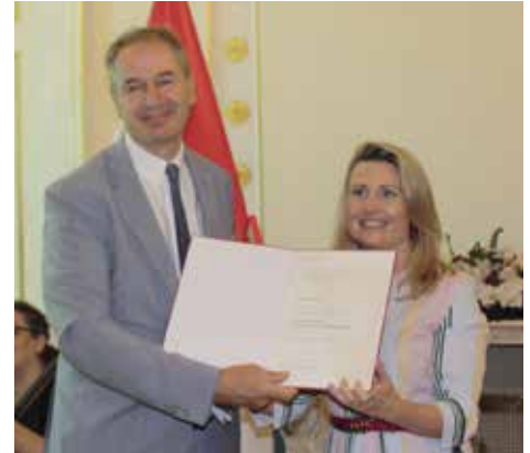
Die Ehrenzeichen wurden am 28. Juni 2024 von Familienministerin Susanne Raab im Bundeskanzleramt verliehen.